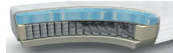
MA235GA gegen Aufpreis