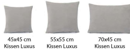
45x45 cm Kissen Luxus