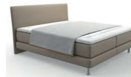
Typ 100 Plaid Klassik komplett geöffnet deckt die Liegefläche nicht ab.