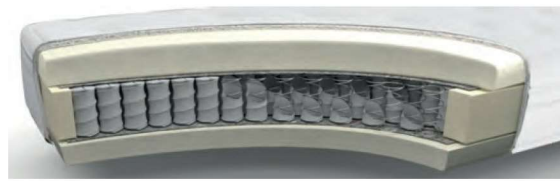
MA235VA gegen Aufpreis