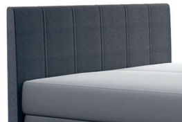
0320 Höhe 115 cm Standard