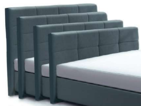
→ 0998S - Höhe 99 cm → 0998M - Höhe 109 cm → 0998L - Höhe 119 cm → 0998XL - Höhe 129 cm gegen Aufpreis