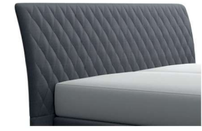
0354 Höhe 116 cm gegen Aufpreis