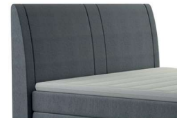
0050 Höhe 117 cm gegen Aufpreis