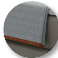
Typ 100 Plaid Klassik Kanten mit Einfassband paspeliert