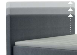
0300 Multimaß Höhe 80 - 125 cm in 5cm-Schritten kürzbar gegen Aufpreis